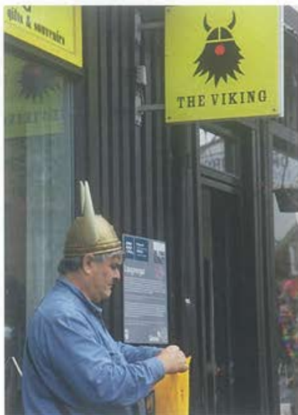
LES ISLANDAIS SONT FIERES DE LEURS ORIGINES VIKING DONT ILS PARLENT ENCORE LA LANGUE.

étincelant de lumière après l'obscurité. Le bâtiment abrite un restaurant et cinq jardins sur les toits.