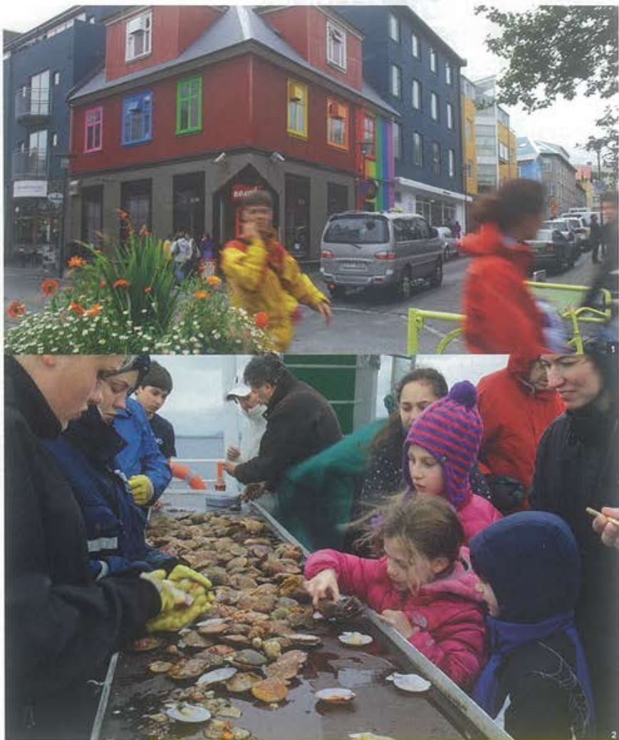
1- IL Y A CHEZ LES ISLANDAIS LA VOLONTÉ DE METTRE DE LA COULEUR PARTOUT POUR COMBATTRE UN CLIMAT MAUSSADE.

On clôturera par la visite du Lagon bleu, situé à une cinquantaine de kilomètres au sud-ouest de Reykjavik, sur la